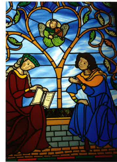
↑ Héloïse et Abélard ; d'après une miniature du 13 e siècle (création) ; Alain Galoin.

Sur tout le territoire, plus de 4 000 bénévoles seront mobilisés les 25 et 26 juin et auront à cœur d'expliquer, de faire visiter et de transmettre leurs connaissances et savoir-faire. Membres d'associations, artisans, passionnés, élus ou tout à la fois, ils vous feront découvrir leurs villages, moulins, fermes, lavoirs, chapelles et autres bijoux de notre patrimoine rural. Partez à leur rencontre et découvrez le patrimoine culturel et naturel comme source et levier d'un développement durable.